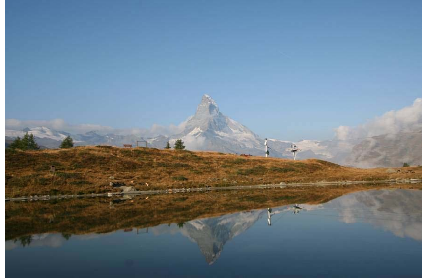
マッターホルンも見えました