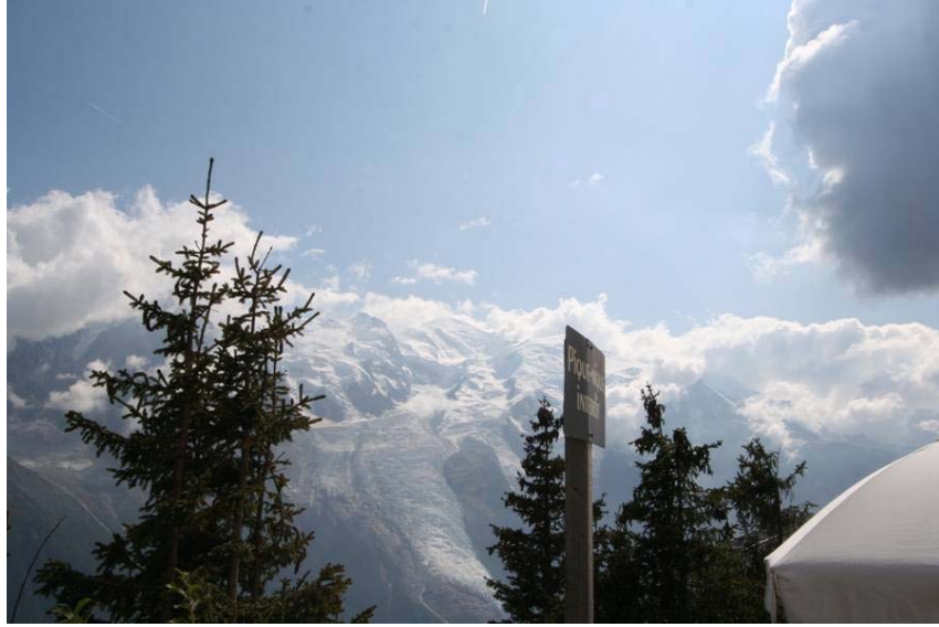
モンブランも見えました